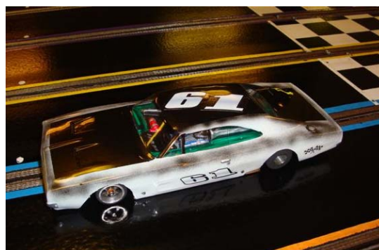
Concourse Jim B