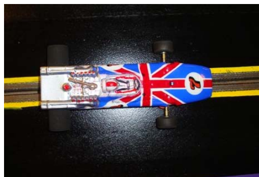
Concourse Stefan T